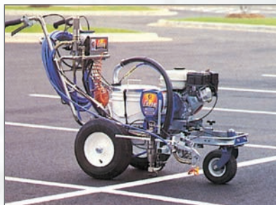
G MACHINE À LIGNE