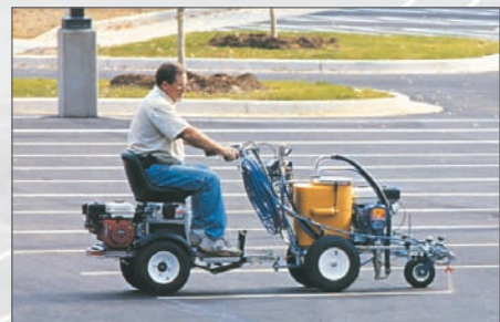
H TRACTEUR POUR MACHINE À LIGNE