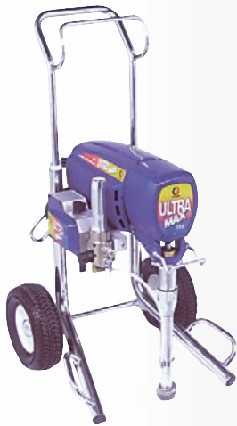
B POMPE À PEINTURE (SANS AIR)