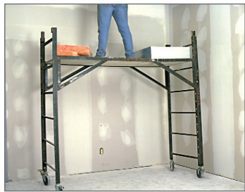
C ÉCHAFAUDAGE ROULANT