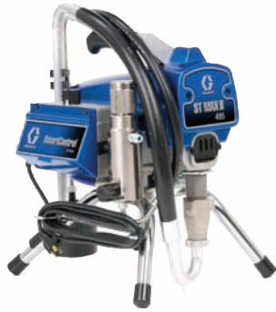
A POMPE À PEINTURE (SANS AIR)